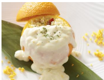
オレンジ炒飯クリームソース