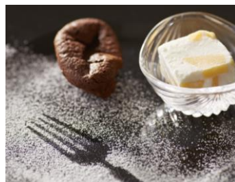
ガトーショコラ マンゴーヨーグルトアイス添え