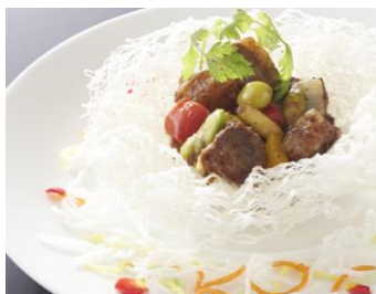
神戸牛バラ肉とアキレス筋の煮込み 黒胡椒炒め