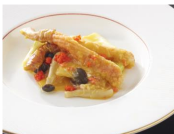
ズワイ蟹の上海蟹味噌煮込み 黒酢添え