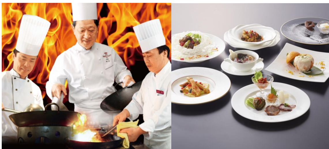
【イメージ写真:「饗宴」スペシャルコース】

中国料理の伝統に三者三様の個性を加味した、はじめての「饗宴」を、ぜひ、この機会にお楽しみください。