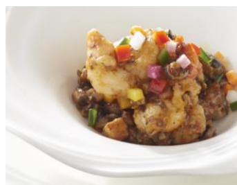
海老の成都チリソース