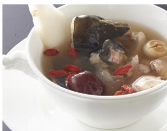
スッポンと丹波地どりの 漢方滋養蒸しスープ